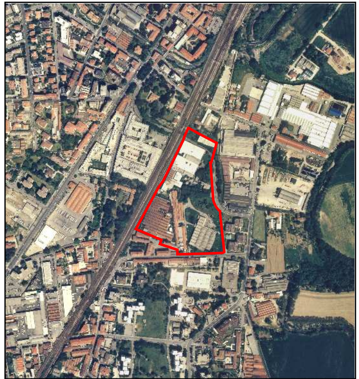
FOTOGRAFIA AEREA scala 1:10.000