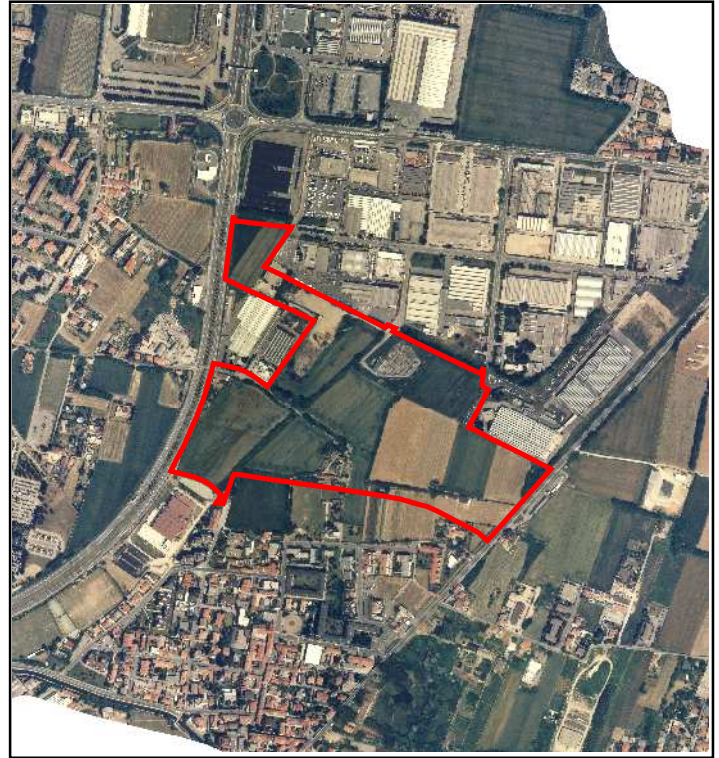
FOTOGRAFIA AEREA scala 1:15.000