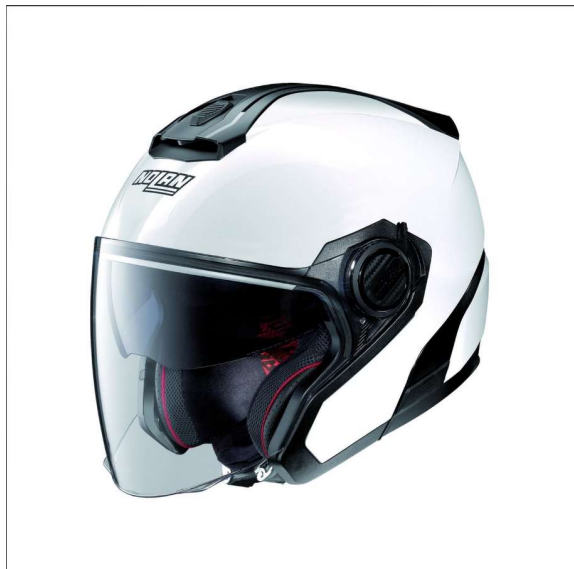
Foto indicativa del prodotto, fanno fede le caratteristiche nella tabella a fianco

La stazione appaltante necessita della fornitura di n. 4 caschi aventi le seguenti caratteristiche tecniche: