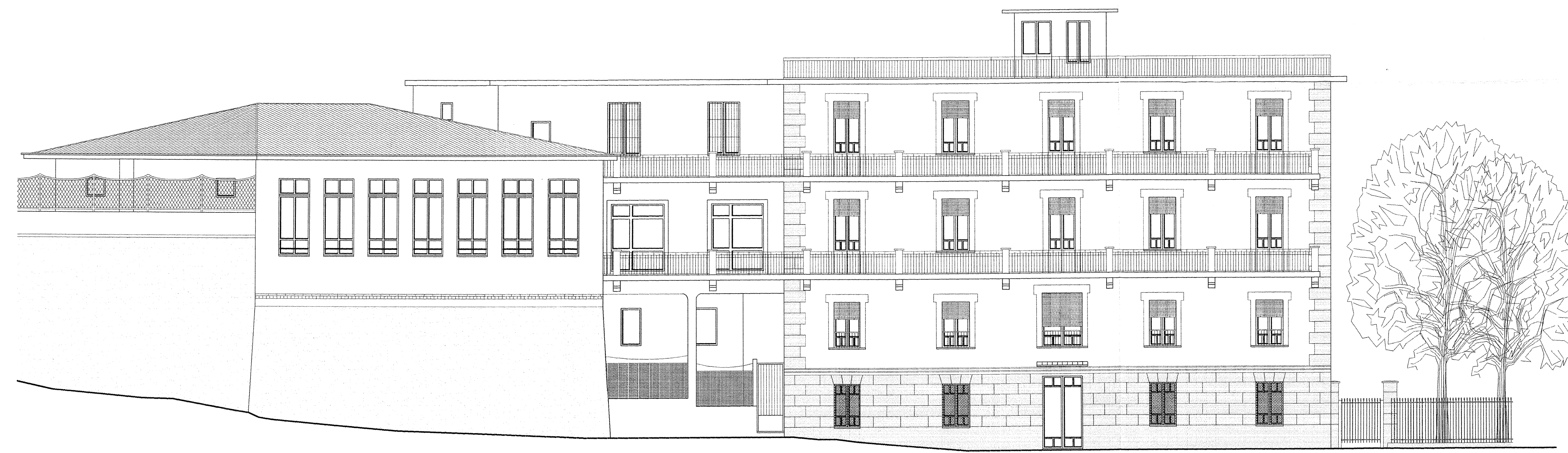
PROSPETTO EST - FRONTE STRADA