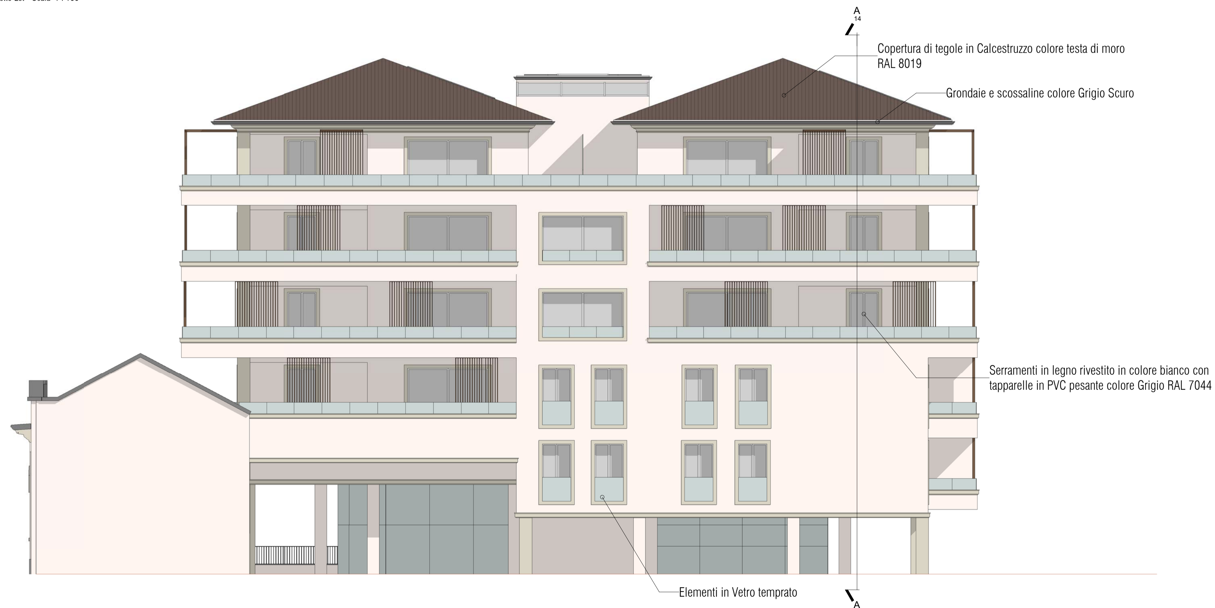
Prospetto Ovest - Scala 1 : 100

Comune di Monza Provincia di Monza e della Brianza