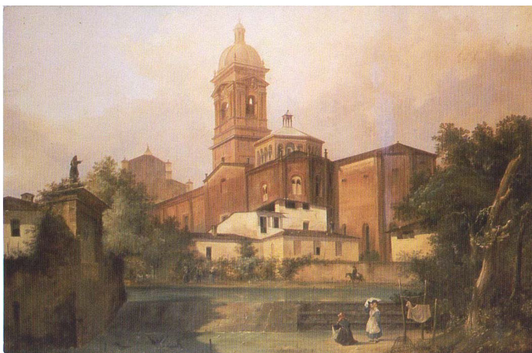
Pompeo Calvi Veduta del Duomo di Monza - 1839 Musei Civici di Monza